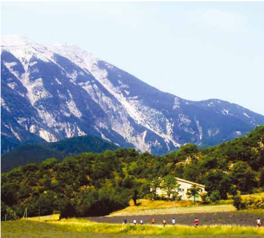
Radler vor dem Mont Ventoux

Außerdem machen wir Halt im munteren Örtchen Bedoin.